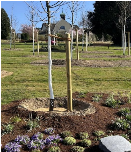
Der neu angelegte „Ruhehain“