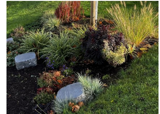
Premium-Grabmal - Liegestein aus schwarzem Granit

Familienbaum: Ein Premium-Baum exklusiv für eine Familie/ Gemeinschaft für bis zu 6 Urnenbeisetzungen